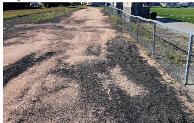
Bilde 1. Gummigranulat på avveie i Nannestad.

Av disse 14 kunstgressbanene har alle SBR-granulat. Det største tapet av gummigranulat kommer fra baner med vinterdrift, men også mindre baner taper granulat til omgivelsene.