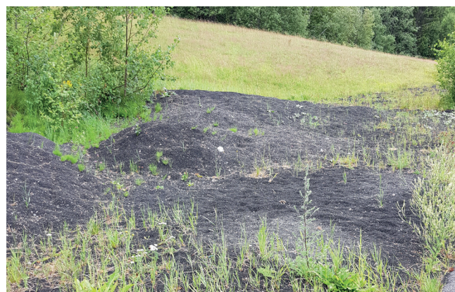
Bilde 1. Granulat på avveie ved Kurlandparken i Lørenskog.

39 av kunstgressbanene har SBR-granulat, to baner i Rælingen har innfyll av sukkerrør, og to baner i Skedsmo har innfyll av henholdsvis sand og kork. Det største tapet av gummigranulat kommer fra baner med vinterdrift, men også mindre baner taper granulat til omgivelsene.