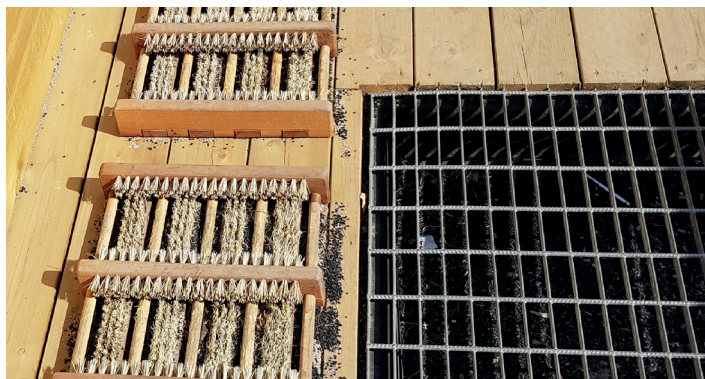
Bilde 2. Eksempel på gjennomført tiltak fra Li idrettsplass i Nittedal.