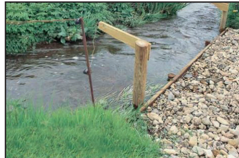
Bilde 5: Etablert drikkeplass for beitedyr