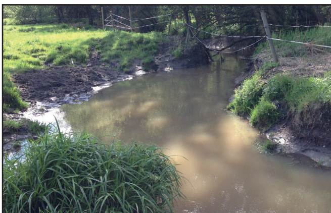
Bilde 1-3: Der et stort antall beitedyr har fri adgang til et vassdrag, kan tråkkskadene bli problematisk store. På øverste bilde, skulle det vært ei rennende elv, som nå er demmet opp av eroderte finpartikler avsatt over lang tid. Ved lav vannføring i elva er det fullstendig stopp for fisk og andre vannlevende dyr.