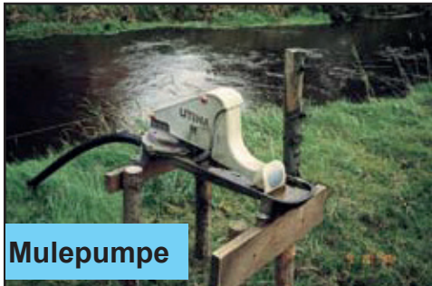
Bilde 4: Mulepumpe